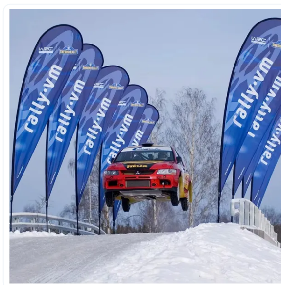
BANDERA PUBLICITARIA GOTA