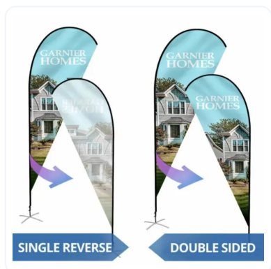
IMPRESIÓN 1 O 2 CARAS