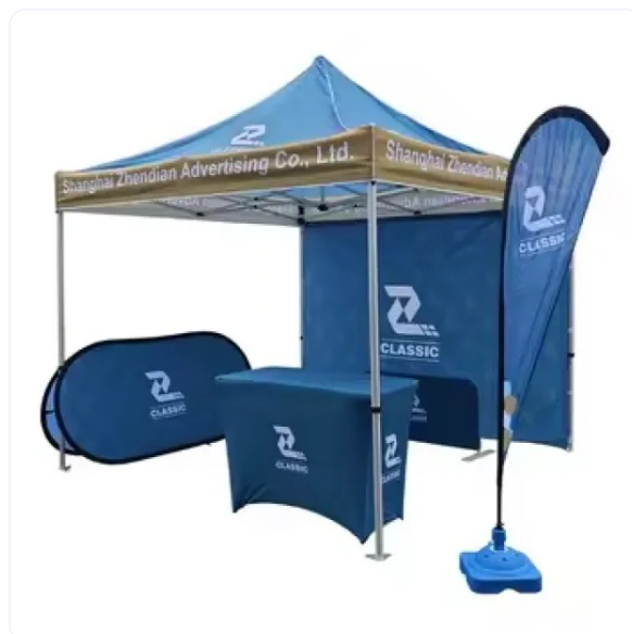
BANDERA PUBLICITARIA GOTA