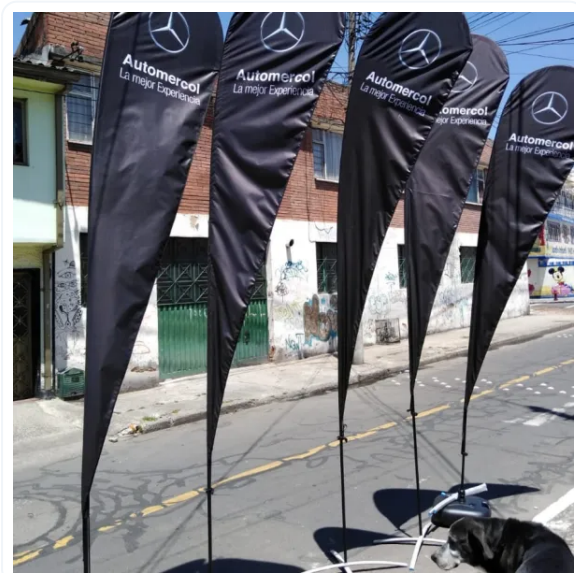
BANDERA PUBLICITARIA GOTA