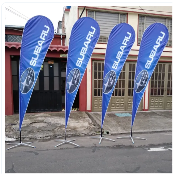
BANDERA PUBLICITARIA GOTA