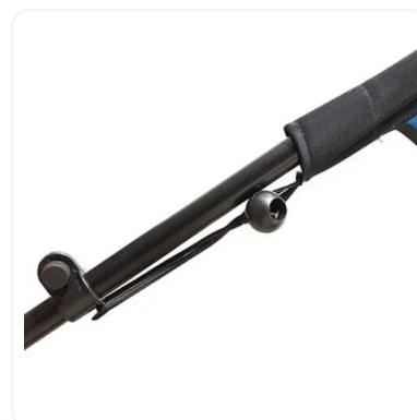
ANCLAJE A MÁSTIL