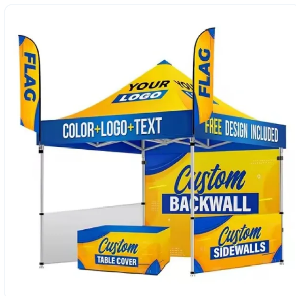
BANDERA PUBLICITARIA VELA