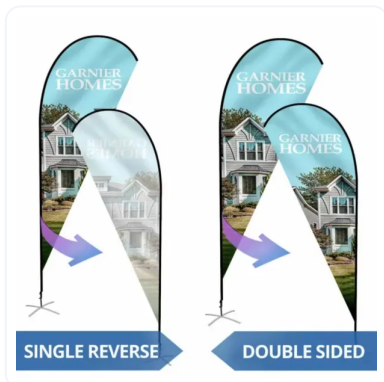
IMPRESIÓN 1 O 2 CARAS