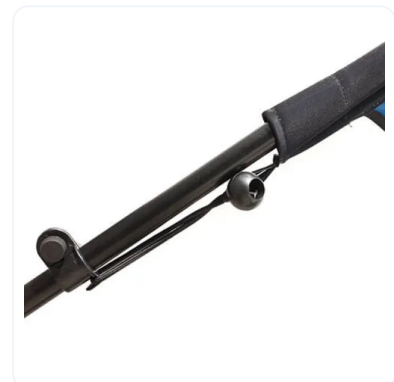
ANCLAJE A MÁSTIL