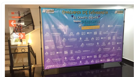
PHOTOCALL EXTENSIBLE XL