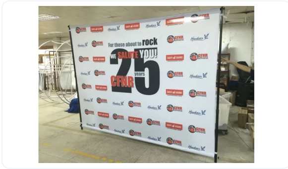
PHOTOCALL EXTENSIBLE XL