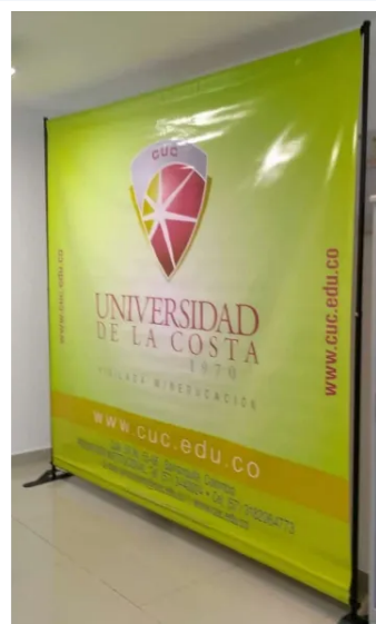
PHOTOCALL EXTENSIBLE XL