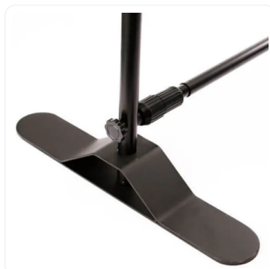
PHOTOCALL EXTENSIBLE XL