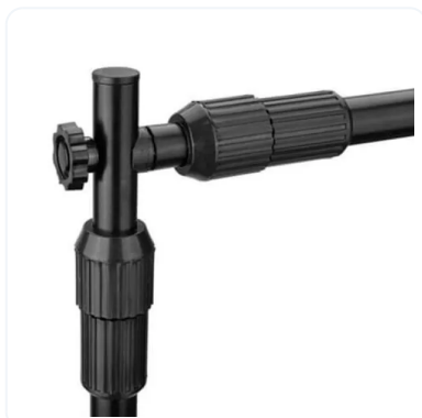
PHOTOCALL EXTENSIBLE XL