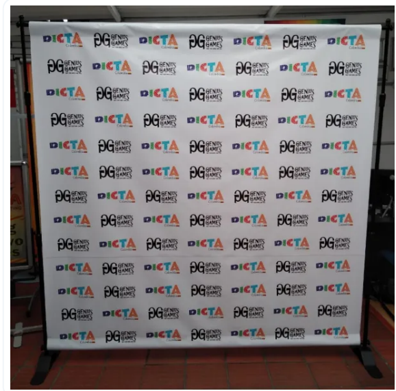
PHOTOCALL EXTENSIBLE XL