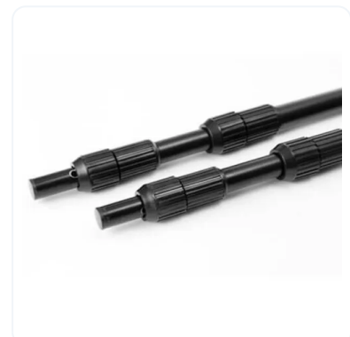
PHOTOCALL EXTENSIBLE XL