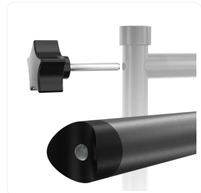
TORNILLOS DE ARMADO