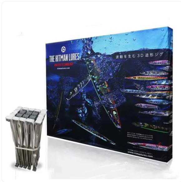
POP UP TEXTIL CON VELCRO