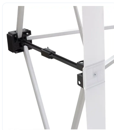
ENGANCHE DE CERRADO