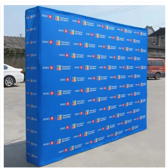
POP UP TEXTIL CON VELCRO