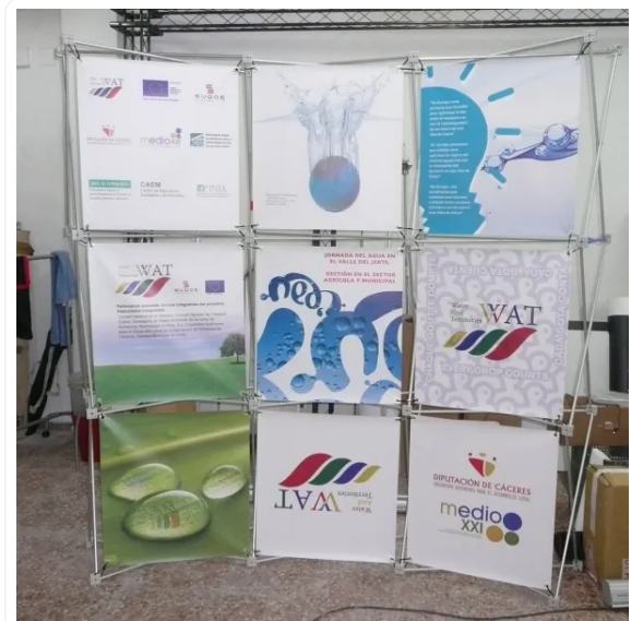
POP UP TEXTIL CON VELCRO