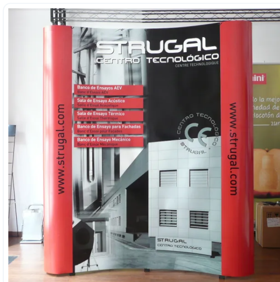
POP-UP 2 CUERPOS