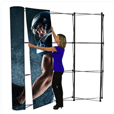
POPOP CURVO MAGNÉTICO