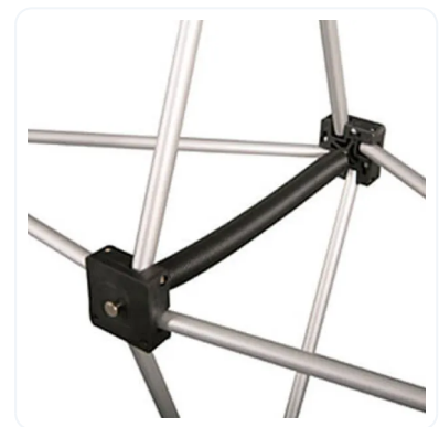
POPOP CURVO MAGNÉTICO