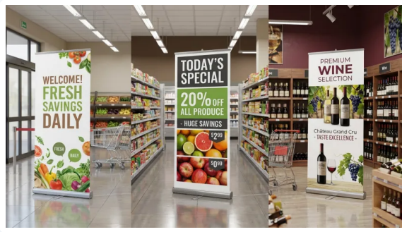
COMUNICAR ES VENDER