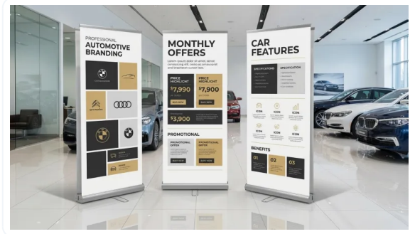
AUMENTE LA RETENCIÓN DE ATENCIÓN DE LOS CLIENTES