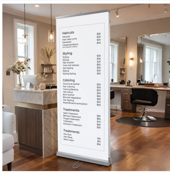
ROLLUPS QUE IMPACTAN Y TRANSMITEN CALIDAD