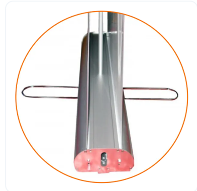
PATA O PIE PARA ESTABILIDAD.