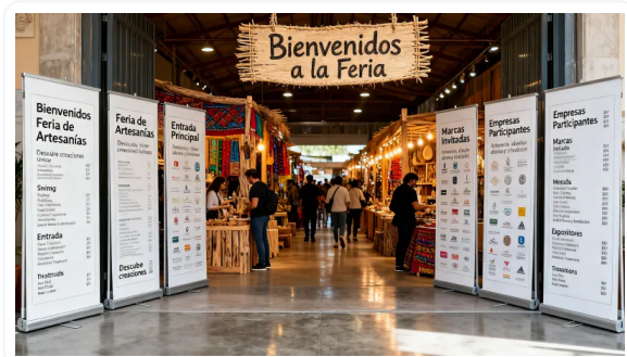
VERSATILIDAD DE USOS