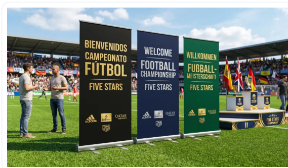
COMUNICAR ES VENDER