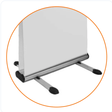
ROLLUP PARA EXTERIORES