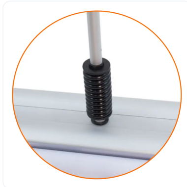
MUELLE O RESORTE DE SEGURIDAD.