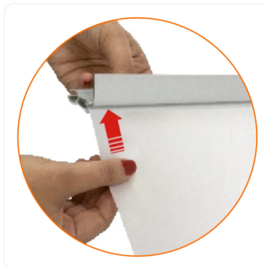
AGARRE A PRESIÓN DE LA GRÁFICA