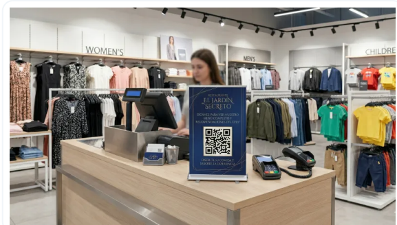
VERSATILIDAD DE USOS