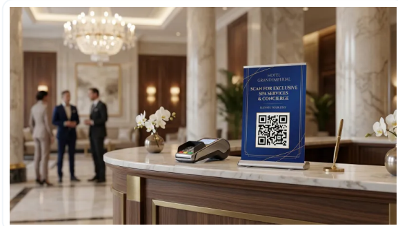
ROLLUPS QUE IMPACTAN Y TRANSMITEN CALIDAD