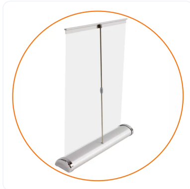
ANCLAJE DE MÁSTIL A BASE