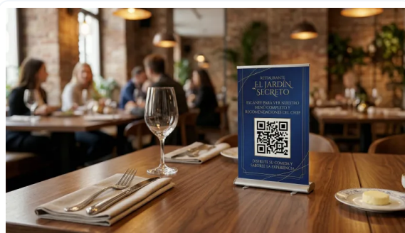
COMUNICAR ES VENDER