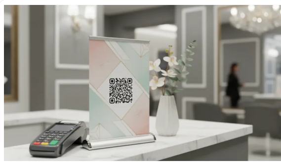
AUMENTE LA RETENCIÓN DE ATENCIÓN DE LOS CLIENTES