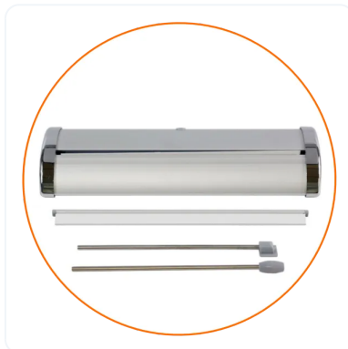
PARTES DE LA ESTRUCTURA.