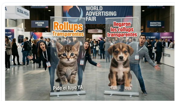
VERSATILIDAD DE USOS