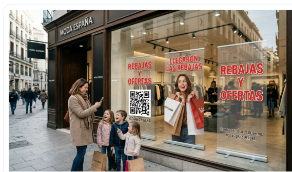
AUMENTE LA RETENCIÓN DE ATENCIÓN DE LOS CLIENTES