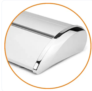
EN ESTRUCTURA DE LUJO