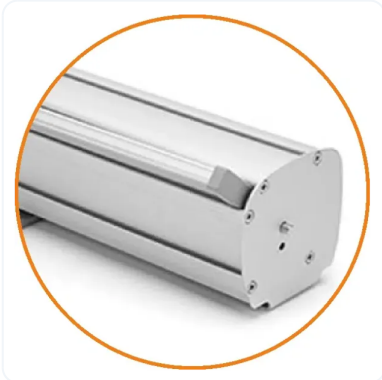
EN ESTRUCTURA GENÉRICA