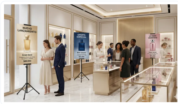
COMUNICAR ES VENDER