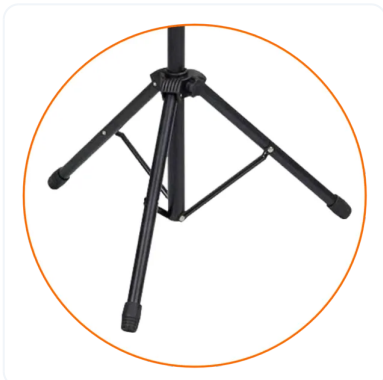
ROLL-UPS ESENCIALES ECONÓMICOS