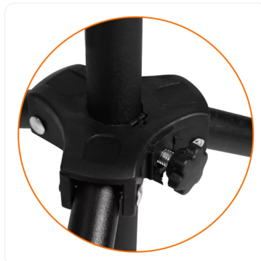
ANCLAJE DE MÁSTIL A BASE