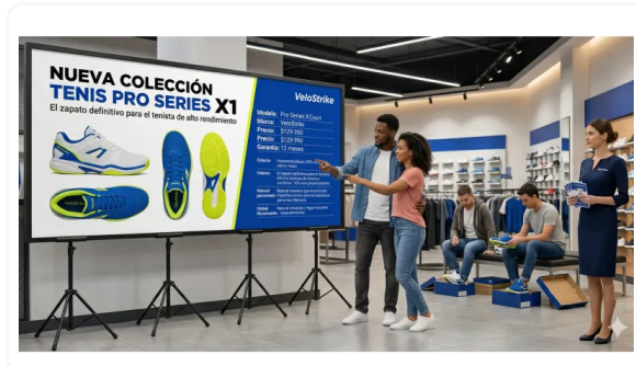
TRÍPODES QUE IMPACTAN Y TRANSMITEN CALIDAD