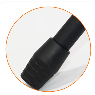
ANTI DESLIZANTE EN PATAS.