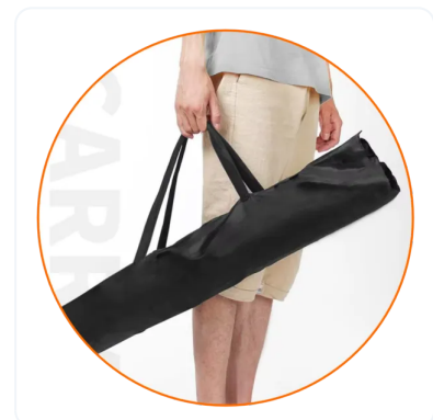
BOLSA DE NYLON NEGRA.