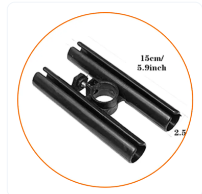
ANCLAJE DE IMAGENES