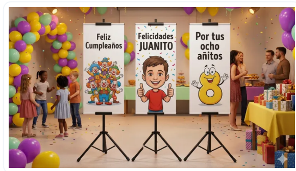
AUMENTE LA RETENCIÓN DE ATENCIÓN DE LOS CLIENTES