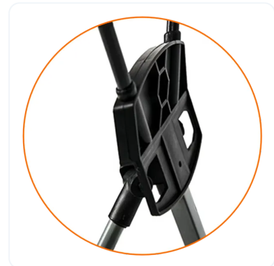
ANCLAJE DE VARILLAS