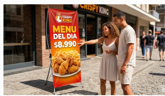
VERSATILIDAD DE USOS