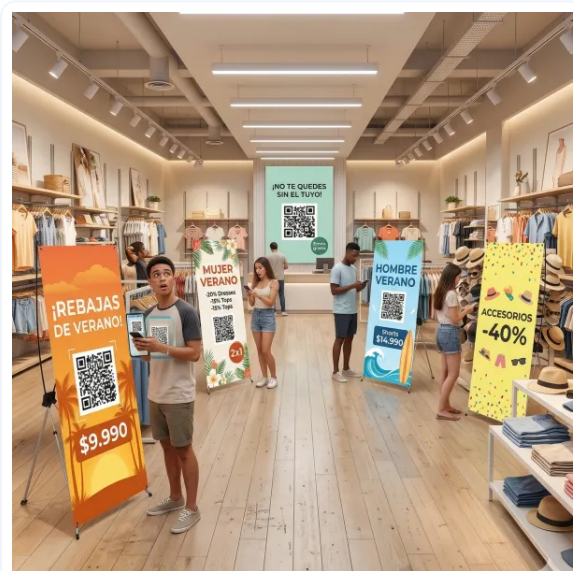
COMUNICAR ES VENDER