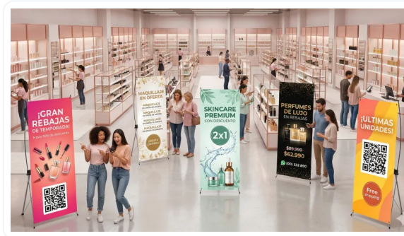
AUMENTE LA RETENCIÓN DE ATENCIÓN DE LOS CLIENTES