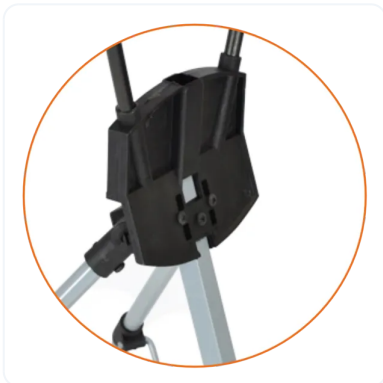
NUDO O UNIÓN PRINCIPAL